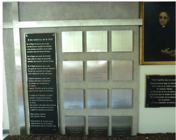
Gedenktafel der Ermordeten in der Kirche der UCA

zieher des Verbrechens vorzugehen. Ein offizielles Vorgehen wurde aber in Spanien auch durch ein Amnestiegesetz verhindert, das zwar gedacht war, um die Folgen des spanischen Bürgerkriegs vergessen zu machen, sich aber in diesem Fall als sehr hinderlich erwies.