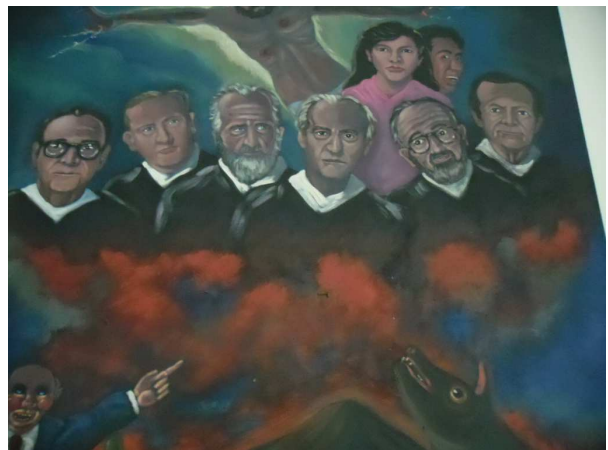
Bild der Ermordeten

Der November des Jahres 1989 war in Deutschland der Monat des Mauerfalls. Deswegen gab es hier damals wenig Aufmerksamkeit für eines der grauenvollsten Geschehnisse des Bürgerkriegs in El Salvador: